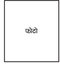
जमानी कर्ताको फोटो